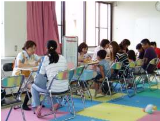
保健師による問診