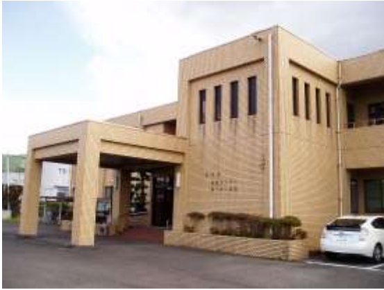
出水保健センター