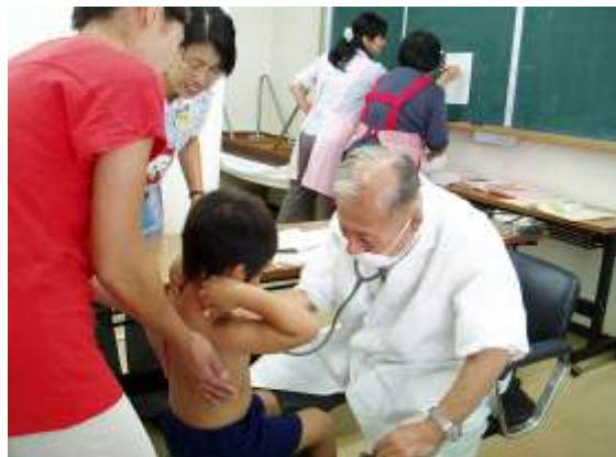
小児科医師による診察