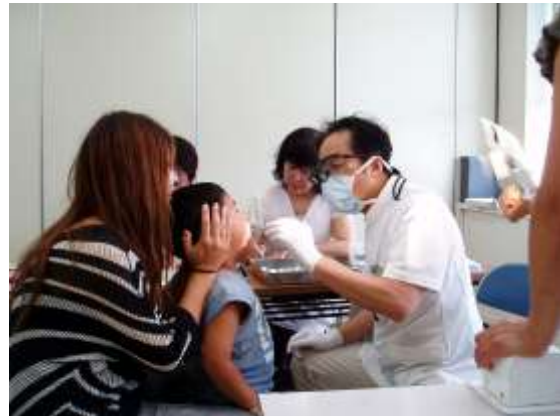
歯科医師による診察