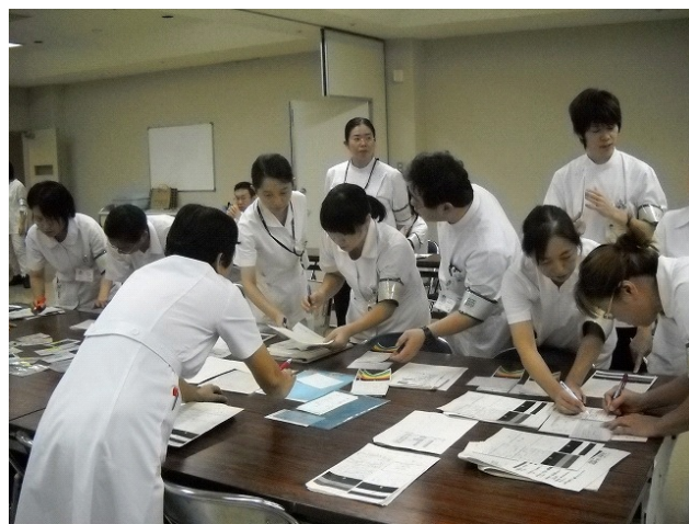
合同での机上訓練の様子