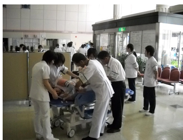
負傷者のトリアージの様子