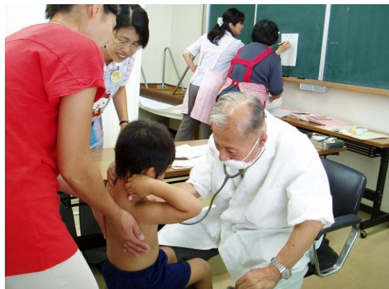
小児科医師による診察