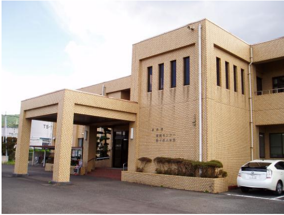
出水保健センター