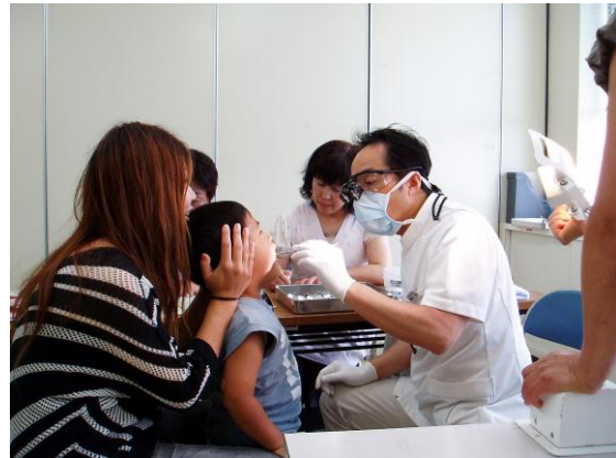
歯科医師による診察