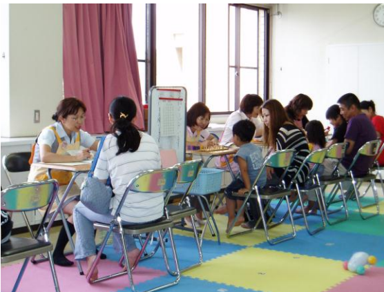
保健師による問診